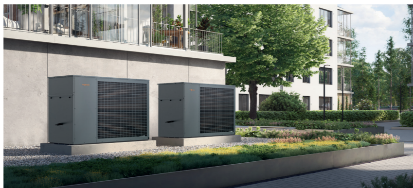
Viessmann Systeme bieten vor dem Hintergrund des GEG und der EE-Pflicht ein Höchstmaß an Zukunftssicherheit und Investitionsschutz.

Alle Heizungsanlagen, insbesondere Öl- und Gasheizungen, für die ein Lieferungs- oder Leistungsvertrag vor dem 19. April 2023 geschlossen wurde und die bis zum Ablauf des 18. Oktobers 2024 zum Zwecke der Inbetriebnahme eingebaut oder aufgestellt werden (§ 71 Abs. 12), müssen keinerlei weitere Auflagen erfüllen – weder jetzt noch in Zukunft.